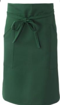
Z49 Verde scuro